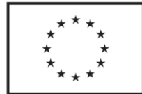
Euroopan unionin osarahoittama