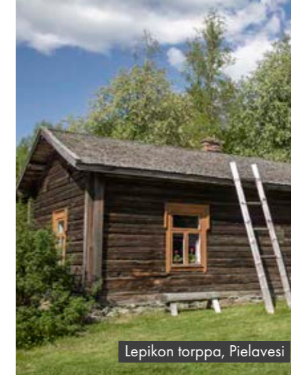
Lepikon torppa, Pielavesi