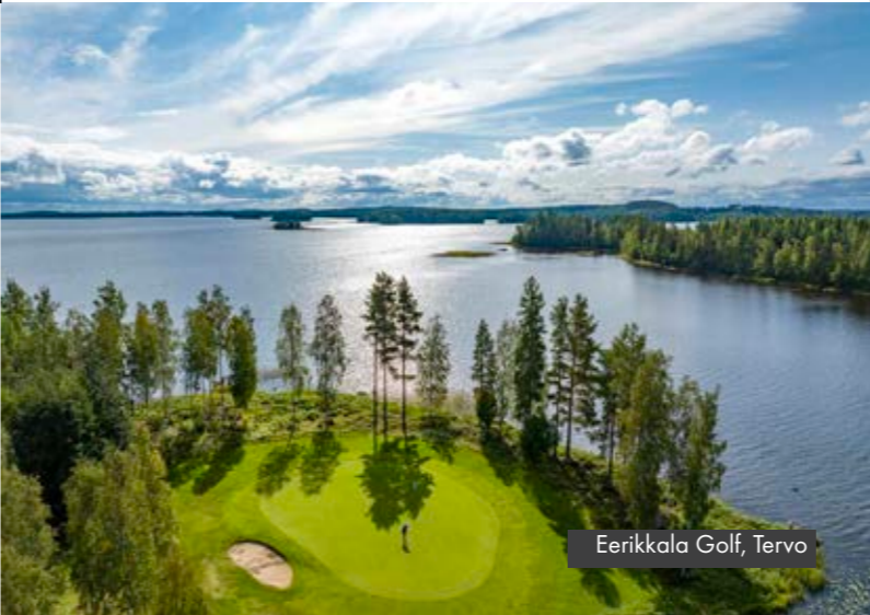
Eerikkala Golf, Tervo

Eerikkala Golf tunnetaan poikkeuksellisen hyvästä palvelustaan, rennosta ilmapiiristään ja leppoisasta tunnelmastaan. Kenttä valittiin vuoden 2023 parhaaksi 9-reikäiseksi golfkentäksi. Hinta-laatusuhteeltaan Eerikkala palkittiin Suomen parhaana jo toista vuotta peräkkäin. Kenttä sai rankingissa myös Suomen viihtyisimmän golfkentän palkinnon. Klubitalo Eerikkalan Kievarin miljöö ihastuttaa museoaitoillaan sekä viihtyisällä 1800-luvun lopun henkeä huokuvalla tuvalla. Ehdotto- masti tutustumisen arvoinen vierailukohde ja ruokapaikka, pelasitpa golfia tai et! www.visitsavo.fi/eerikkala-golf