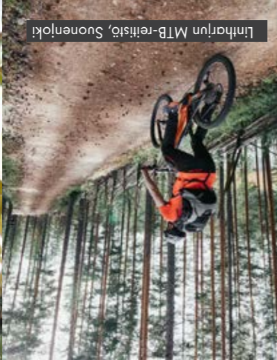
Linhartun MTB-reitistö, Suonenjoki