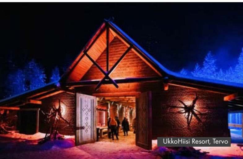
UkkoHiisi Resort, Tervo