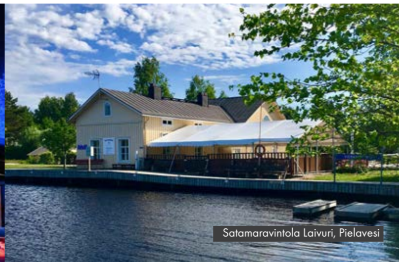
Satamaravintola Laivuri, Pielavesi