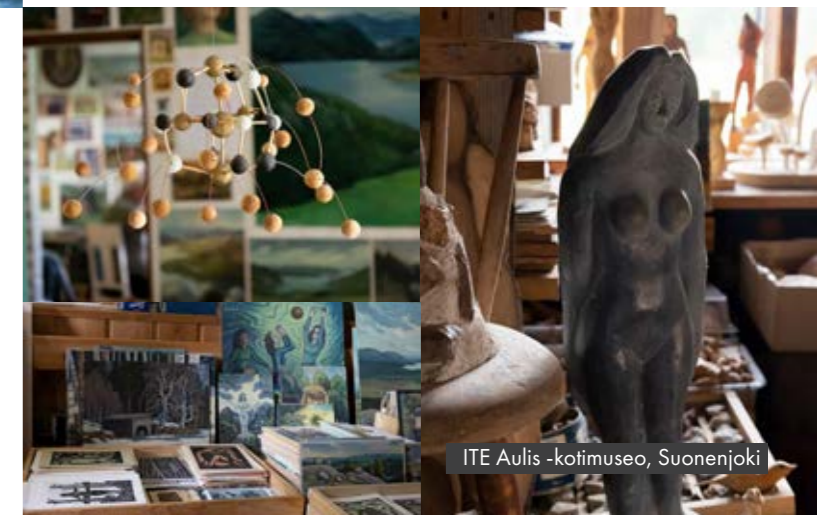
ITE Aulis -kotimuseo, Suonenjoki